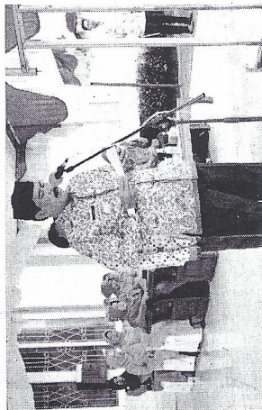
Wabup Idrus, mewakili Gubernur Kalbar Cornelis, memimpin upacara bendera HUT Pemprov Kalbar ke-58 di halaman Disdik KKU di Sukadana, Rabu (28/1). Dan Peserta upacara dari perwakilan SKPD di lingkungan Pemerintah KKU, utusan berbagai kesatuan, hingga perwakilan murid-murid SMP dan SMA di Sukadana, Rabu (28/1). HIMPUN SETIA KNU

Wakil Bupati (Wabup) Kayong Utara memimpin upacara, membacakan amanat Gubernur Kalbar Drs Cornelis MH, mengucapkan selamat ulang tahun yang ke-58 kepada Pemprov Kalbar serta seluruh masyarakat Provinsi Kalbar.