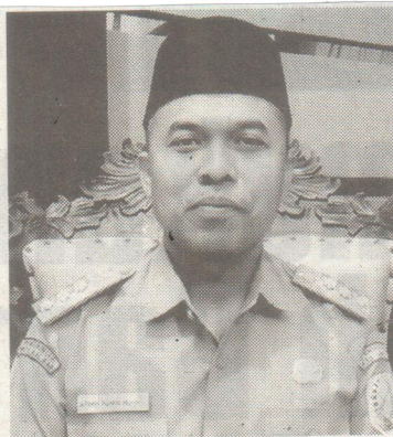
H. Atbah Romin Suhaili Lc

Bupati menegaskan, jangan sampai negara sudah membantu melalui BOS, justru aliran dananya diselewengkan. “Kita harus selalu